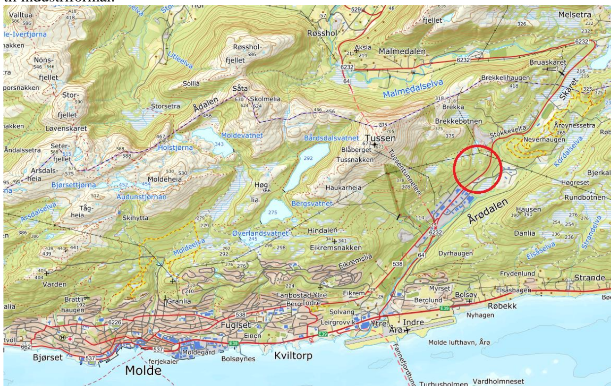
Figur 1: Oversiktskart som illustrerer planområdet beliggenhet.

Hensikten med planen er å tilrettelegge deler av eiendommen, gnr/bnr 33/12 Molde kommune, til industriformål.