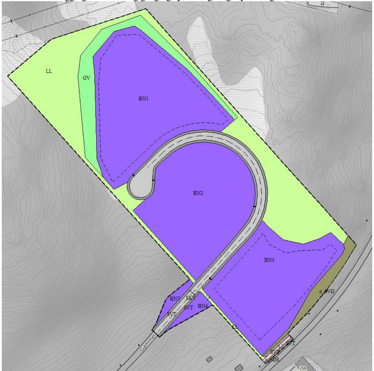
Figur 2: Reguleringsforslag